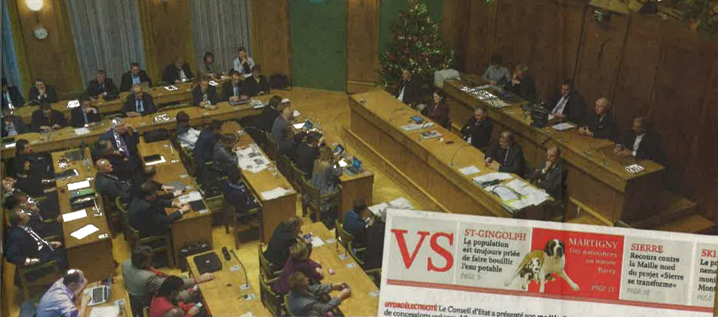
La Commission économie et énergie du Grand Conseil a annoncé son soutien au modèle présenté en janvier par le Conseil d'Etat. LE NOUVELLISTE