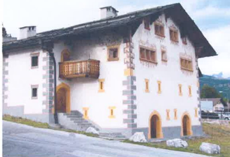
Le Musée des bisses devrait bénéficier d'un coup de pouce financier étatique pour sa contribution à la sauvegarde du patrimoine culturel valaisan.