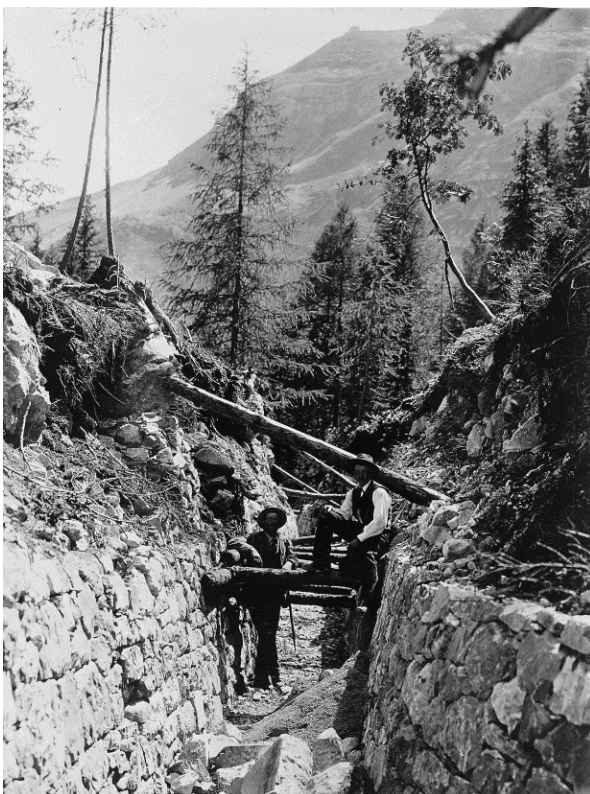
Arbeiten an der Suone von Sion, 1907