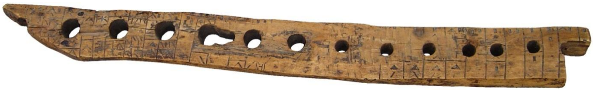
Wasserscheit von Ayent (1737)