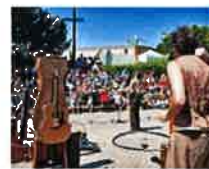
Mar us Artelier

Grâce à la programmation très variée de ses spectacles, le Diabolo Festival est un vrai paradis pour les enfants (de 2 ans à 10 ans). Ils peuvent se plonger dans des univers tantôt amusants, captivants ou poétiques. Ils passent ainsi sans transition d'un concert d'Henri Dès à des contes, d'un spectacle de magie à des jeux, d'un atelier (de menuiserie, de grimpes, etc.) aux arts du cirque. Diablement envoûtant quand on a moins de 11 ans.